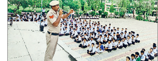
कैथल। युवाओं को जागरूक करते पुलिस कर्मचारी।