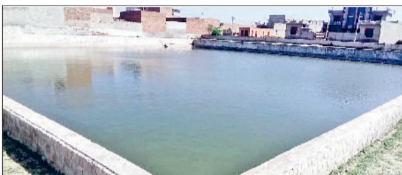
अलेवा। बधाना गांव जलघर में दिखाई देते भरे पानी के टैंक।

13 जुलाई को आयोजित होने वाली हॉफ मैराथन को लेकर तैयारियां पूरी कर ली गई हैं। शुक्रवार सायं डीसी प्रीति व एसपी आस्था मोदी ने मैराथन रूट सहित 12 जुलाई को आयोजित होने वाली बैठकों को लेकर आरकेएसडी कॉलेज का दौरा किया। जहां तैयारियों की समीक्षा करते अंतिम रूप दिया। डीसी ने आमजन का आह्वान किया है कि वे हॉफ मैराथन में बढ़चढ़ कर भाग लें। डीसी एसपी ने प्रिंसिपल कक्ष, मुख्य सभागार कक्ष का दौरा किया। पार्किंग परिया का निरीक्षण किया। इसके बाद अधिकारियों ने मैराथन रूट का बारीक से निरीक्षण कर अधिकारियों को आवश्यक दिशा-निर्देश जारी किए।