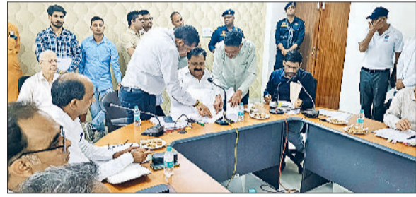
जींद। अधिकारियों की मीटिंग लेते डिप्टी स्पीकर डा. कृष्ण मिश्रा।