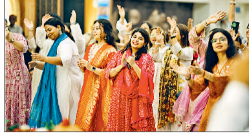
कैथल। गुरु पूर्णिमा के अवसर पर झूमते श्रद्धालु।

गुठला चौका। गुठला उपमंडल के गांव तारवाली के प्राथमिक विद्यालय तारवाली में विश्व जनसंख्या दिवस मनाया गया। रेडक्रॉस जूनियर काउन्सिल एवं शिक्षक गुरुदीप उरलाना ने बच्चों को बढ़ती जनसंख्या के बारे में विस्तार से समझाया। उन्होंने बच्चों को विश्व जनसंख्या दिवस के बारे में बताया कि यह एक अत्यंत महत्वपूर्ण दिवस है। इस दिवस पर हमें अपने परिवार और समाज के प्रति जागरूक रहना चाहिए। उन्होंने बच्चों को विश्व जनसंख्या दिवस के बारे में बताया कि यह एक अत्यंत महत्वपूर्ण दिवस है। इस दिवस पर हमें अपने परिवार और समाज के प्रति जागरूक रहना चाहिए। उन्होंने बच्चों को विश्व जनसंख्या दिवस के बारे में बताया कि यह एक अत्यंत महत्वपूर्ण दिवस है। इस दिवस पर हमें अपने परिवार और समाज के प्रति जागरूक रहना चाहिए।