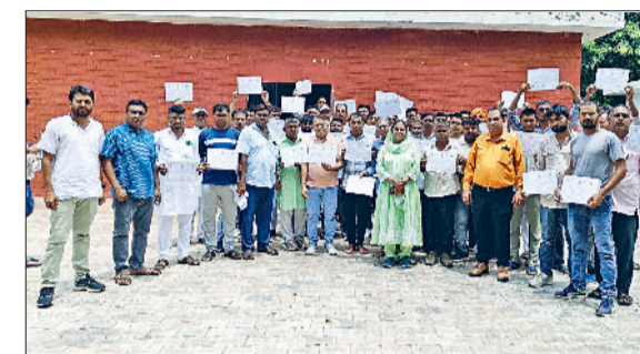
जीद। सर्टिफिकेट वितरित करते हुए।

दिशा में प्रयोग करें, पढ़ाई और खेलों में रुचि लें और अपने माता-पिता व गांव का नाम रोशन करें- उन्हें प्रेरित किया गया कि वे खुद तो नशे से दूर रहें ही, साथ ही अपने परिवार व आस-पड़ोस में भी लोगों को नशे के दुष्परिणामों के बारे में जागरूक करें।