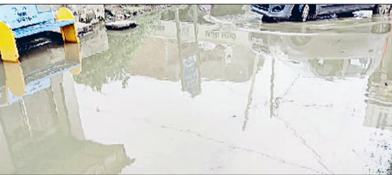
उचाना। उचाना कलां शिव मंदिर को जाने वाले रास्ते में भरा बिना बारिश पानी।

सावन माह शुरू होने से मंदिर आने-जाने वाले श्रद्धालुओं के साथ-साथ यहां स्थित स्कूल आने-जाने वाले विद्यार्थियों को परेशानी होती है। गंदे पानी से होकर ही आवागमन श्रद्धालुओं, विद्यार्थियों