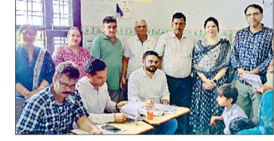
जीद। शिविर में जांच करते हुए चिकित्सक।

जुलाना। कस्बे के बीडीपीओ कार्यालय में तीन माह से वेतन नहीं मिलने पर वामणी सफाई कर्मचारियों का धरना शुकवार को दूसरे दिन भी जारी रहा। अध्यक्षता शशीका सफाई कर्मचारियों के प्रधान मनकपल ने की। मनकपल ने कहा कि सफाई कर्मचारियों को तीन माह से वेतन नहीं मिल रहा है। जिससे उन्हें काफी आर्थिक संकट से होकर गुजरना पड़ रहा है। बच्चों की पढ़ाई से लेकर रसोई खर्च चलाने में भी सफाई कर्मचारियों असमर्थ हो रहे हैं। कई बार इस संबंध में शिकायत भी दी लेकिन कोई भी समाधान नहीं हो पाया। जब तक सफाई कर्मचारियों को वेतन नहीं मिलता तब तक धरना जारी रहेगा। धरने पर कर्मचारियों ने सरकार और प्रशासन के खिलाफ उमकट नारेबाजी करते रोष प्रकट किया। सफाईकर्मी लगातार दूसरे दिन भी धरने पर रहे और थाली बजाकर रोष प्रकट किया लेकिन कोई भी अधिकारी कर्मचारियों की सुध लने नहीं पहुंचा। जुलाना के बीडीपीओ और एसडीपीओ छुटी पर हैं। जुलाना बीडीपीओ को एडिशनल चार्ज सफाई के बीडीपीओ को दिया गया है लेकिन वे भी जुलाना नहीं पहुंचे।